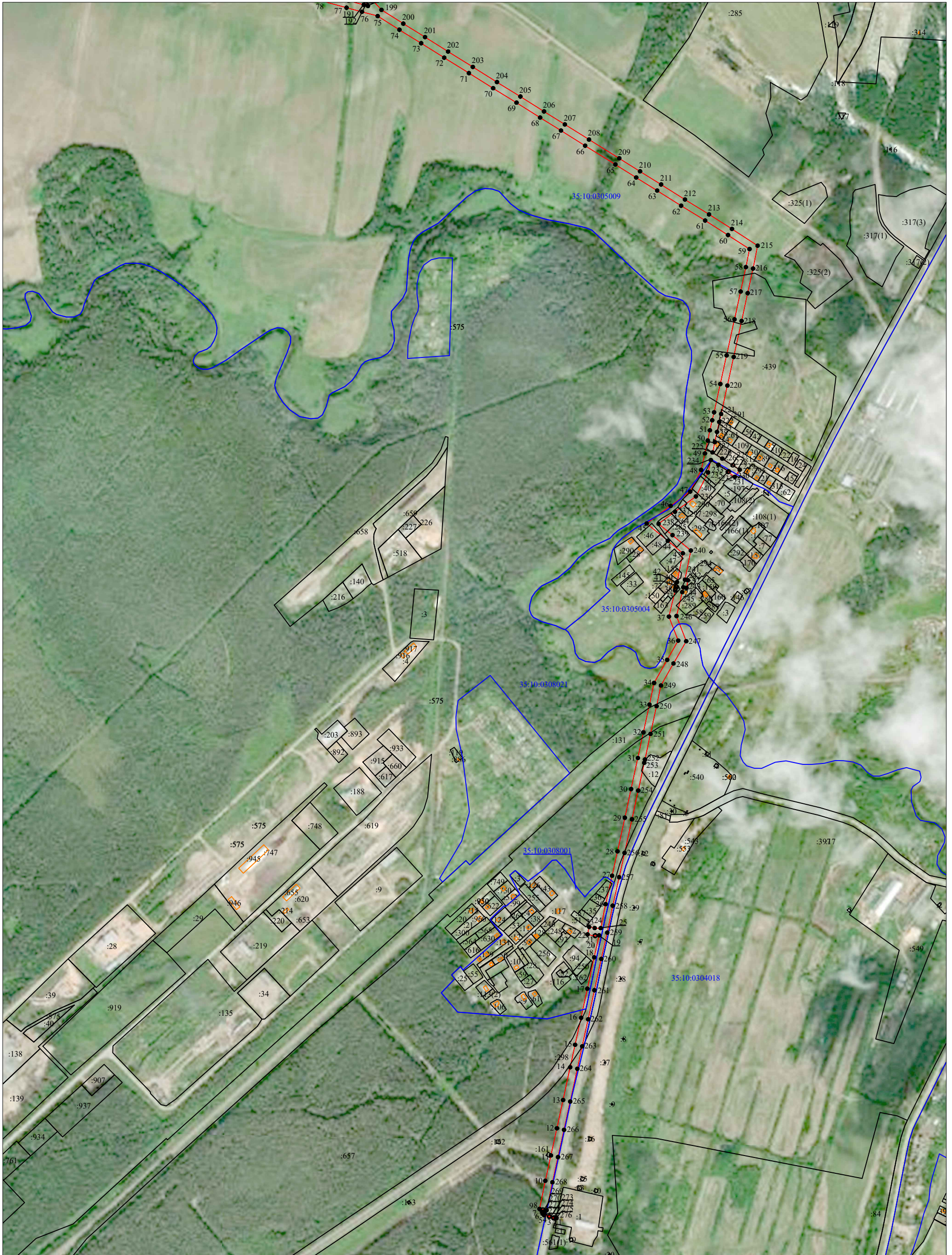
Схема расположения границ публичного сервитута "Комплекс электролиний 6 кВ "Великий Устюг 2" (ВЛ-6 кВ «Будрино»)"