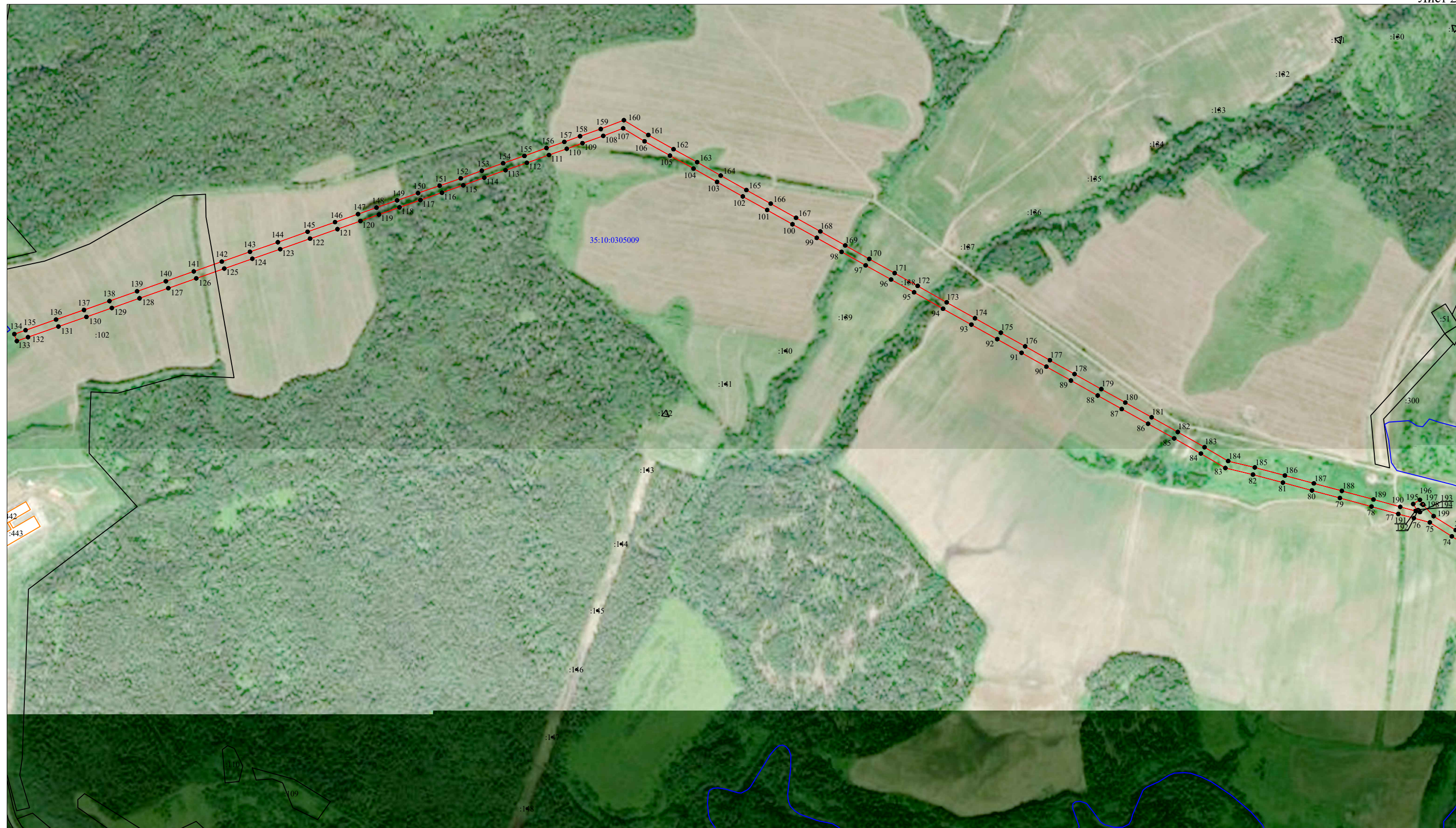
Схема расположения границ публичного сервитута "Комплекс электролиний 6 кВ "Великий Устюг 2" (ВЛ-6 кВ «Будрино»)"